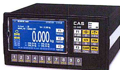
Рисунок 1 – Общий вид терминалов весоизмерительных CI, NT

Принцип действия терминалов основан на преобразовании входного электрического цифрового сигнала, поступающего от АЦП внешнего устройства и его вывода в единицах массы на цифровое встроенное табло.